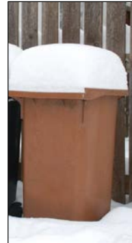
Biotonne im Winter